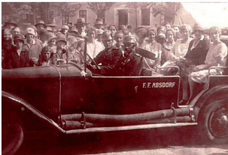
Mannschaftswagen (Mit diesem geschah der Unfall mit der Eisenbahn)