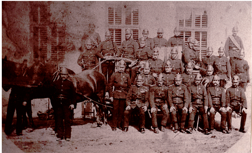
Freiwillige Feuerwehr Absdorf um 1900

Im August 1938 war es wieder einmal die Schmida, die aus ihren Ufern trat und das halbe Dorf überschwemmte.